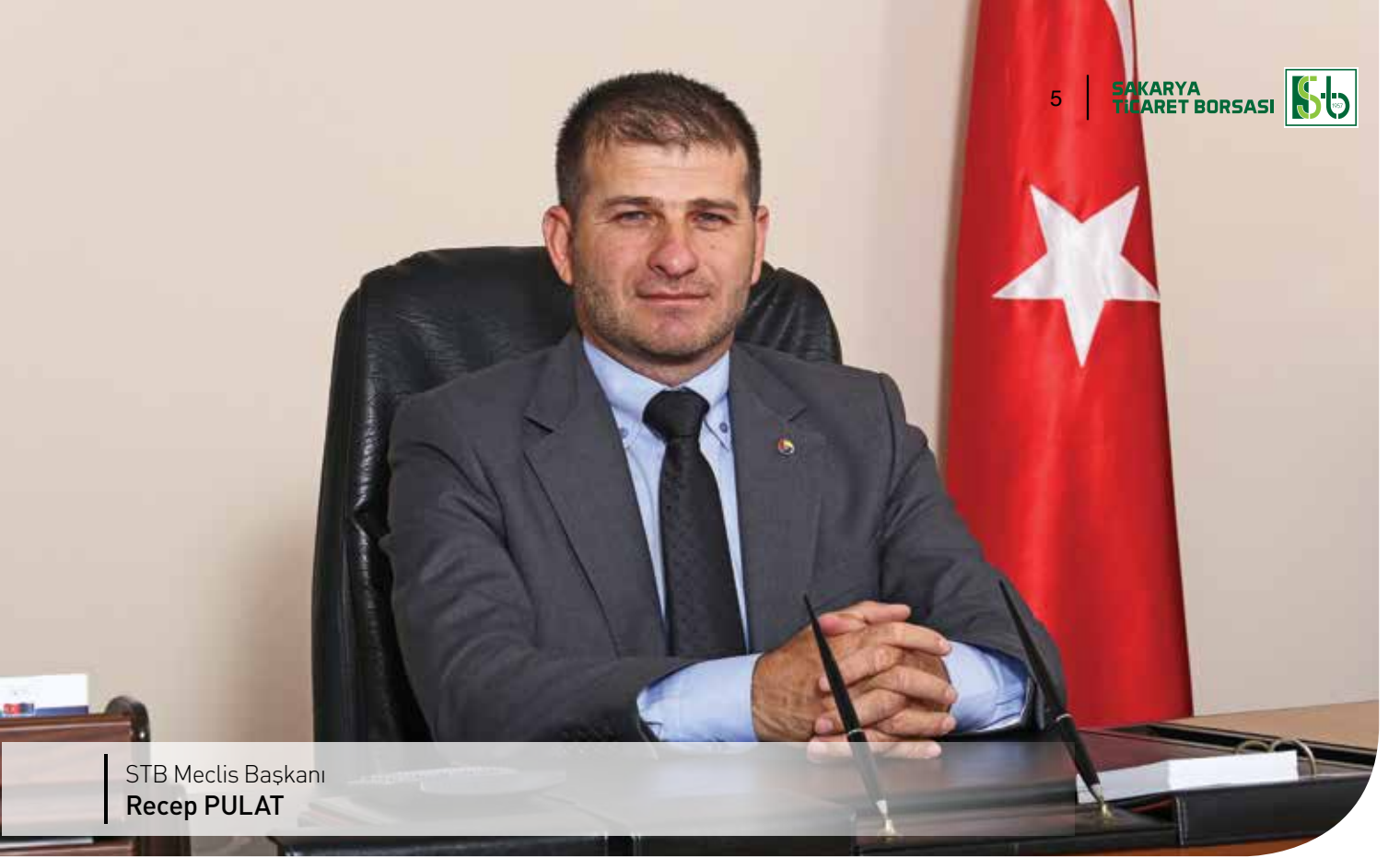
STB Meclis Başkanı Recep PULAT