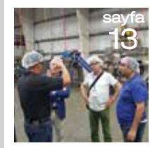
Türk Fındık Sektörünün Washington ve Oregon Ziyareti