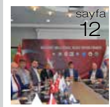
15 Temmuz Demokrasi Milli Birlik ve Beraberlik Günü Ortak Basın Toplantısı Düzenlendi