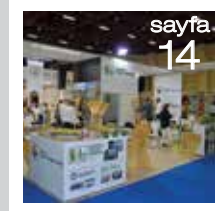
STB YÖREX Fuarı'na Katıldı