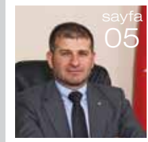
Meclis Başkanından S.T.B. Meclis Başkanı Recep PULAT