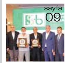
STB'de 40. Yılı Ödül Töreni Düzenlendi